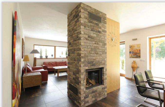
Cegły i płytki ręcznie formowane – 45 Lithium

Zastosowanie: elewacje wszelkiego rodzaju budynków, elementy dekoracyjne we wnętrzach, ogrodzenia i mała architektura.