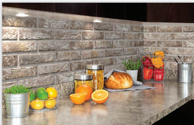
Cegły i płytki ręcznie formowane – 79 Ancius

Zastosowanie: elewacje wszelkiego rodzaju budynków, elementy dekoracyjne we wnętrzach, ogrodzenia i mała architektura.