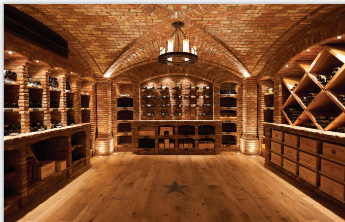
Cegły i płytki ręcznie formowane – 60 Oud Brabant

Zastosowanie: elewacje wszelkiego rodzaju budynków, elementy dekoracyjne we wnętrzach, ogrodzenia i mała architektura.