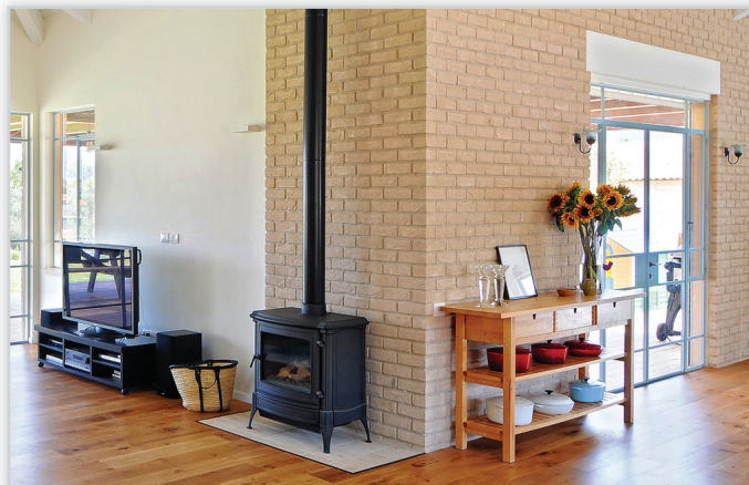
Cegły i płytki ręcznie formowane – 38 Creme

Zastosowanie: elewacje wszelkiego rodzaju budynków, elementy dekoracyjne we wnętrzach, ogrodzenia i mała architektura.