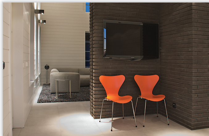
Cegły i płytki ręcznie formowane – 533 Morvan

Zastosowanie: elewacje wszelkiego rodzaju budynków, elementy dekoracyjne we wnętrzach, ogrodzenia i mała architektura.